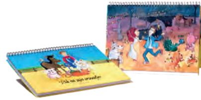
Het verhalenboek Rik en zijn vriendjes

Voor je ligt het KiVa-katern: Rik de Pauw. Dit KiVa-katern is onderdeel van het lespakket Rik de Pauw dat bestaat uit drie onderdelen: