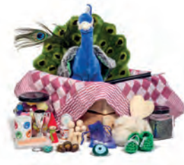
De leskist met achttien items