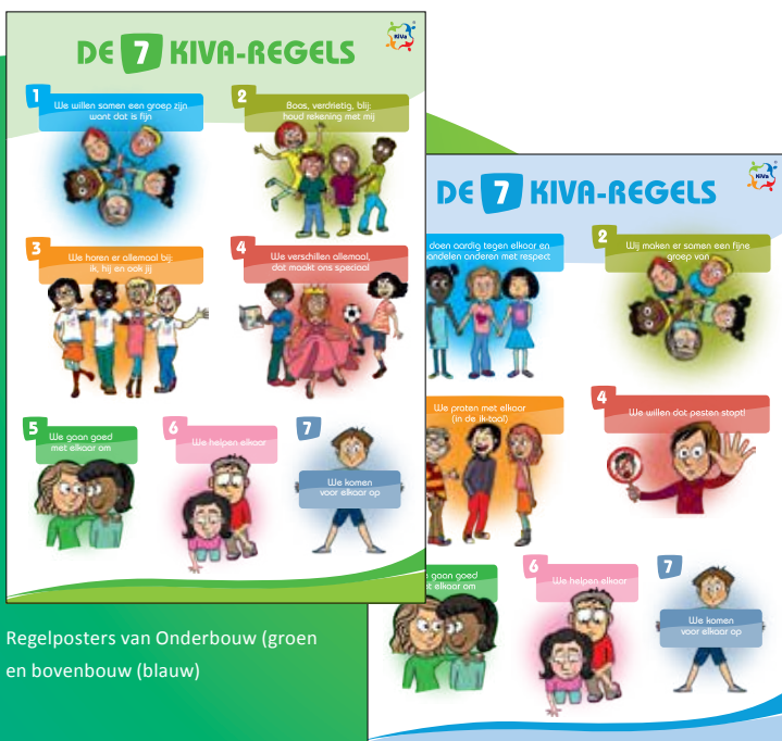
Regelposters van Onderbouw (groen) en bovenbouw (blauw)

Bij KiVa geloven we in de kracht van de groep. Bij het bedenken van goede ideeën, of het organiseren van leuke dingen, maar ook bij het oplossen en voorkomen van problemen in de groep wordt de nadruk gelegd op de verantwoordelijkheid die alle kinderen hebben voor het welzijn in de groep. Iedereen is (mede-)verantwoordelijk voor de sfeer in de groep. Hoewel niet iedereen verantwoordelijk is voor het ontstaan van een probleem, kan wel iedereen iets doen om te werken aan de oplossing. De kracht van de groep wordt ingezet voor gedragsverandering. Dit sluit aan bij de theorie van rolbenadering 1 . Door middel van KiVa leren kinderen strategieën die ze in kunnen zetten om problemen in de groep op te lossen en belangrijker nog om ze te voorkomen. Daarbij is het uitgangspunt dat iedereen (leerkrachten, leerlingen en ouders) sterke kanten heeft, die kunnen bijdragen aan een positieve sfeer. Kortom samen verantwoordelijk voor een fijne groep.